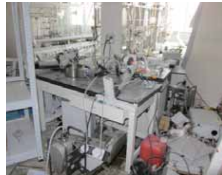
機材が散乱した化学実験室