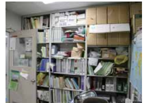
転倒すると通路をふさぐ棚（名大の例）

非常時には互いに助け合うことが必要です。教職員と学生で非常時の対応を定期的に確認しましょう。研究室などでは、教員との緊急連絡方法の確認や災害時の非常持ち出し品の準備などもしましょう。