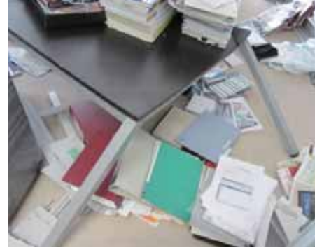
転倒した書棚に潰されたテーブル

車内放送を聞き、落ち着いて係員の指示に従います。勝手にドアを開けて外に出ないこと。対向車両などの危険があります。