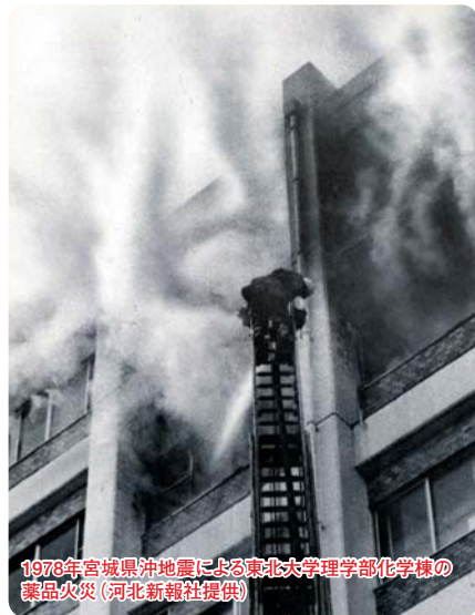
1978年宮城県沖地震による東北大学理学部化学棟の薬品火災