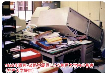
1995年阪神・淡路大震災による神戸大学内の被害